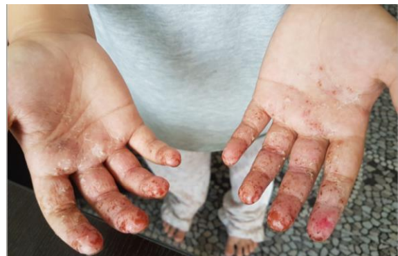
Photo 1 : dermatite de contact due à la manipulation de Slime

Par voie cutanée, 78% des cas identifiés par les CAP étaient symptomatiques (21 cas sur 27) avec des lésions locales rapportées telles que brûlures cutanées, rougeurs, démangeaisons. Pour l'un des cas, des lésions du cuir chevelu et des oreilles en plus des mains témoignaient de la toxicité probablement manuportée du Slime.